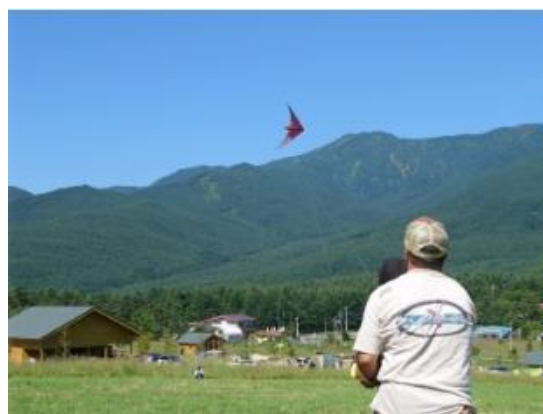
熱気球係留体験、スポーツカイト体験イメージ