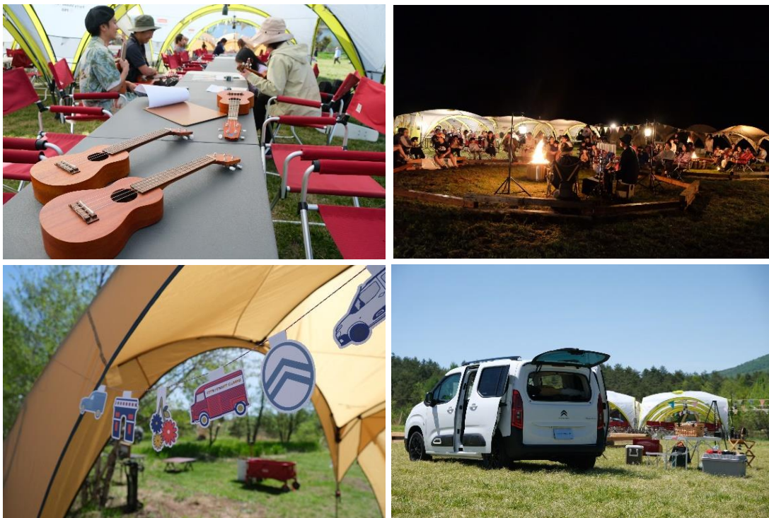
2024 年実施の Citroënist Camp の様子